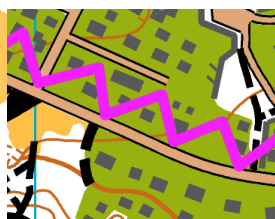
Galima važiuoti šaligatviu